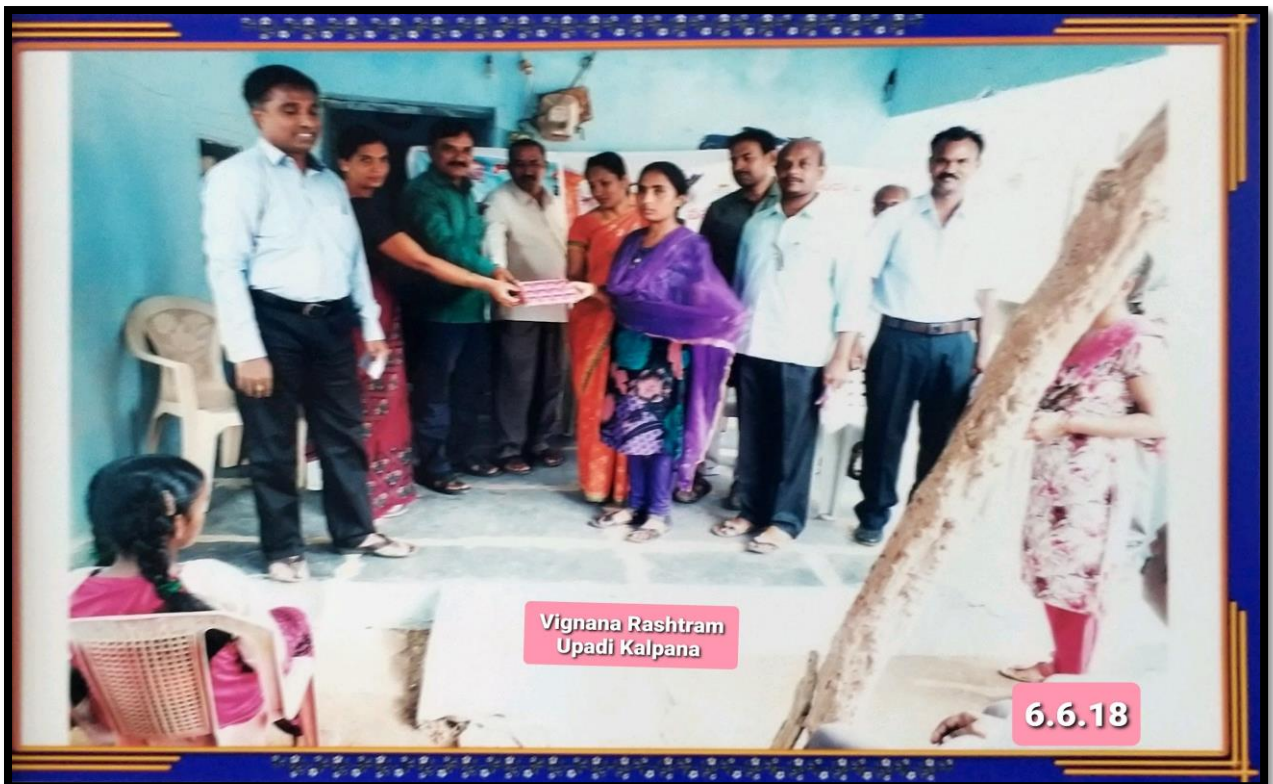
Vignana Rashtram Upadi Kalpana